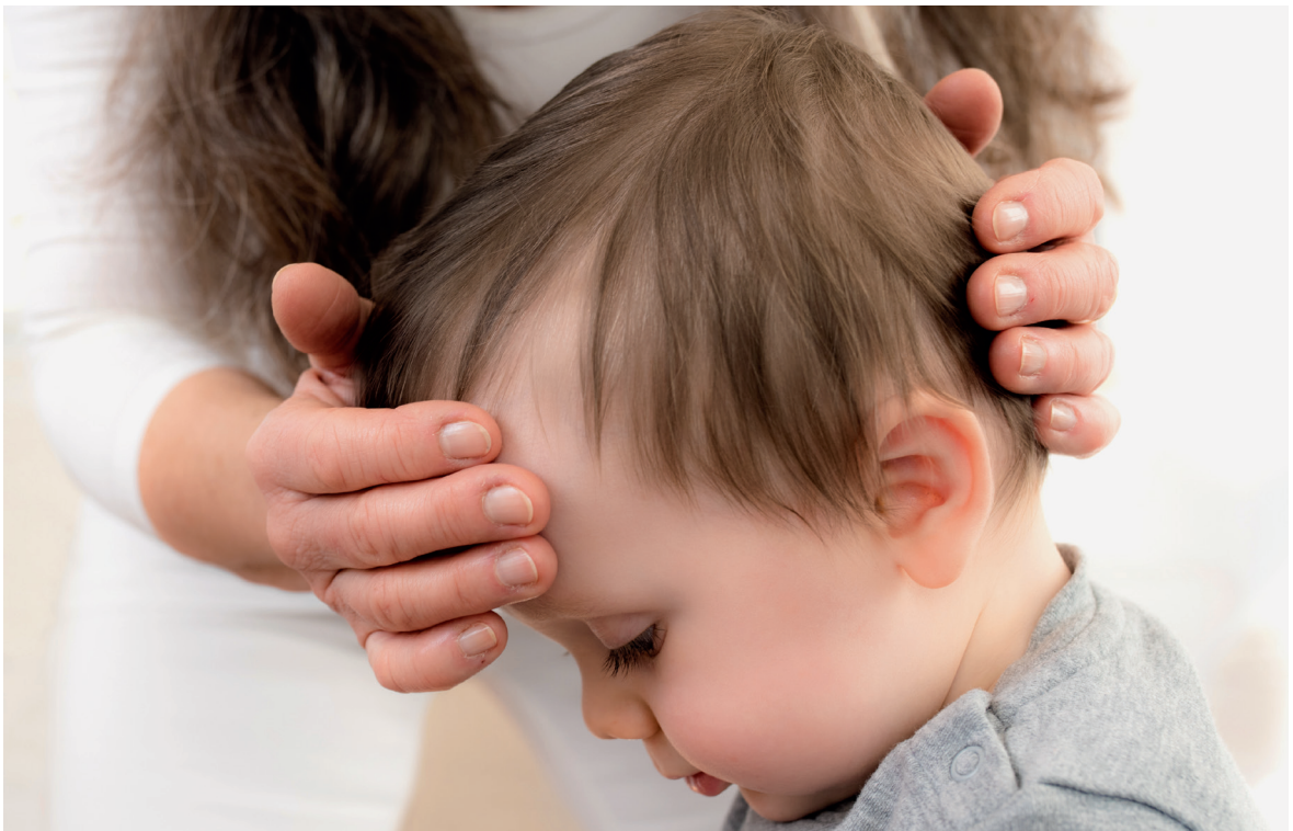
Abb. 22: Fronto-nasaler Ausgleich

Wieder können wir uns über das „Lauschen“ ein Bild über die Stellung, die Bewegung und die Synchronität des Os frontale und des Os occipitale machen. Jede Bewegung des Stirnbeines wird über die duralen Membranen, vor allem der Falx cerebri, auf das Hinterhauptsbein übertragen und umgekehrt. Ein Modelling der beiden kann mit der Pumptechnik oder einem Unwinding kombiniert, einen Ausgleich der miteinander verbundenen Gewebe bewirken. Wenn die Bewegung wieder synchron ist, kann man davon ausgehen, dass es einen Ausgleich mit dem craniosacralen Rhythmus gibt.