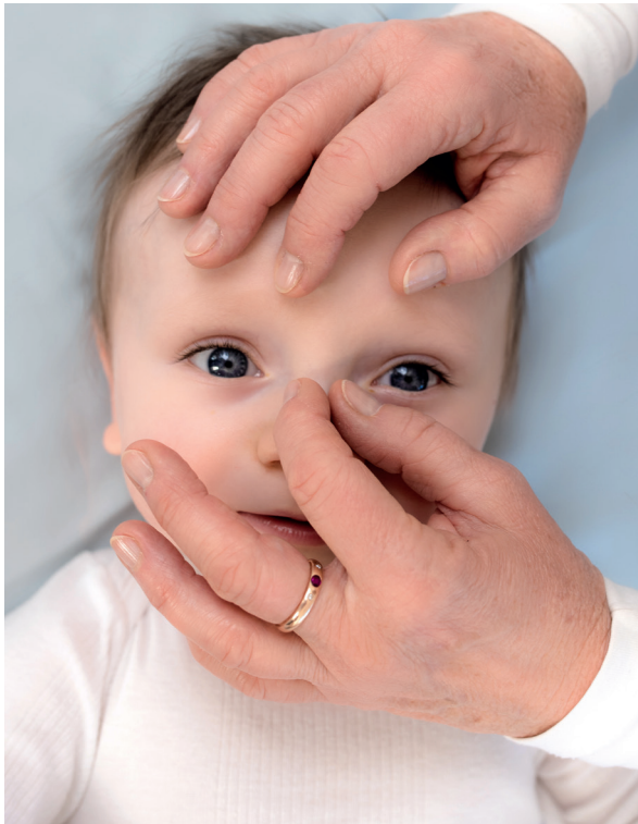
Abb. 23: Lösen des Falxansatzes

Sobald wir einen Ausgleich erreicht haben, können wir mit der Hand, die auf dem Stirnbein liegt, leicht pumpen. Relativ schnell zeigt sich ein Öffnen der Gesichtsschädelknochen.