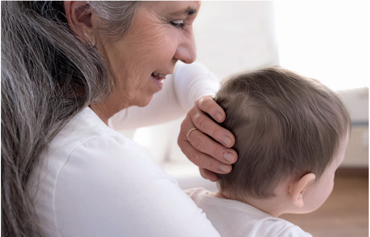
Abb. 20: Ausgleich des Os occipitale

Die Handposition hängt von der Form der Hand des Behandlers und der Form des kindlichen Schädels ab.