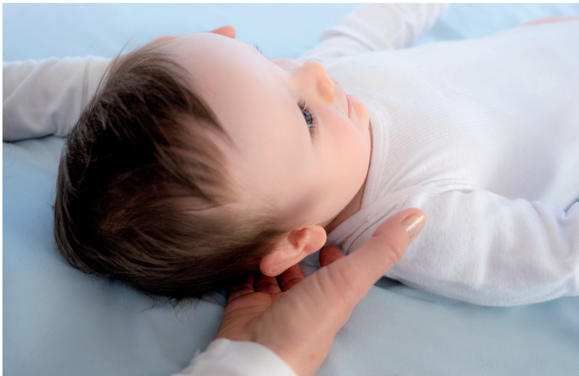
Abb. 21: Korrektur des Foramen magnum

Das Alter und die Reaktionen des Kindes bestimmen die Handpositionen. Ideal wäre die Rückenlage. Bei einem Säugling können wir mit einer Hand arbeiten. Die Finger sind nach caudal ausgerichtet, posterior des Foramen magnum, der 2. und 3. Finger auf einer Seite, der 4. und 5. auf der anderen.